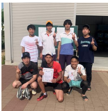
〈伊香 S T A〉