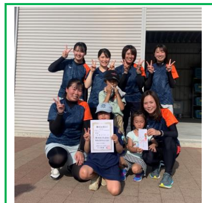
〈大津 S T A〉